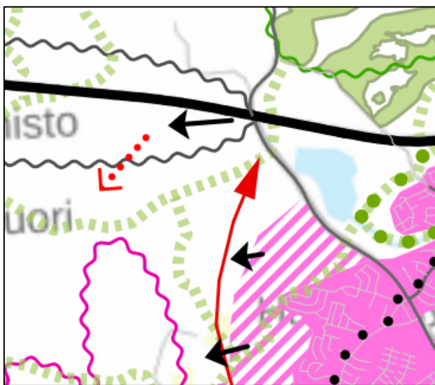
Kuva: Ote strategisesta yleiskaavaehdotuksesta (Nokian kaupunki, strategisen yleiskaavan ehdotus, 17.9.2024)

Vireillä olevan Nokian strategisen yleiskaavan ehdotuksessa, joka on ollut nähtävillä 26.9. – 28.10.2024, suurin osa alueesta on osoitettu selvitettäväksi elinkeinoelämän alueeksi. Merkinnällä on osoitettu mahdolliset tulevat elinkeinoelämän alueet, joiden toteuttamisen mahdollisuudet selvitetään. Aluerajaus täsmennetään tarkemmassa suunnittelussa.