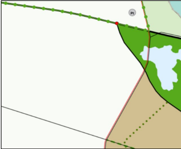
Kuva: Karttaote maakuntakaavasta (Pirkanmaanliiton karttapalvelu, maakuntakaava, 16.9.2024)

koskevissa suunnitelmissa ja päätöksissä tulee ottaa huomioon alueen luontoarvot