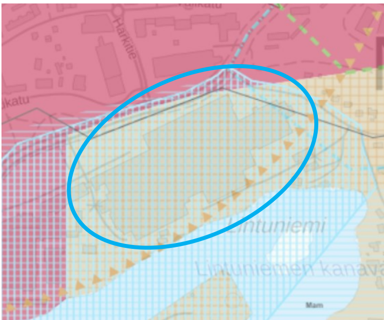
Kuva: Ote Pirkanmaan maakuntakaava 2040:stä. Suunnittelualue on merkitty sinisellä viivalla karttaan.

Lisäksi osa suunnittelualueesta kuuluu tiivistettävään asemanseltuun. Merkinnällä osoitetaan yhdyskuntarakenteeltaan tiivistettävät alueet, jotka tukeutuvat ensisijaisesti raideliikenteeseen. Suunnittelumääräys: Alueen suunnittelussa ja toteutuksessa on pyrittävä raideliikennettä tukevaan tiiviiseen yhdyskuntarakenteeseen sekä laadukkaisiin kävelyn ja pyöräilyn yhteyksiin. Tiivistettävän alueen laajuus tulee tarkentaa yksityiskohtaisemmassa suunnittelussa.